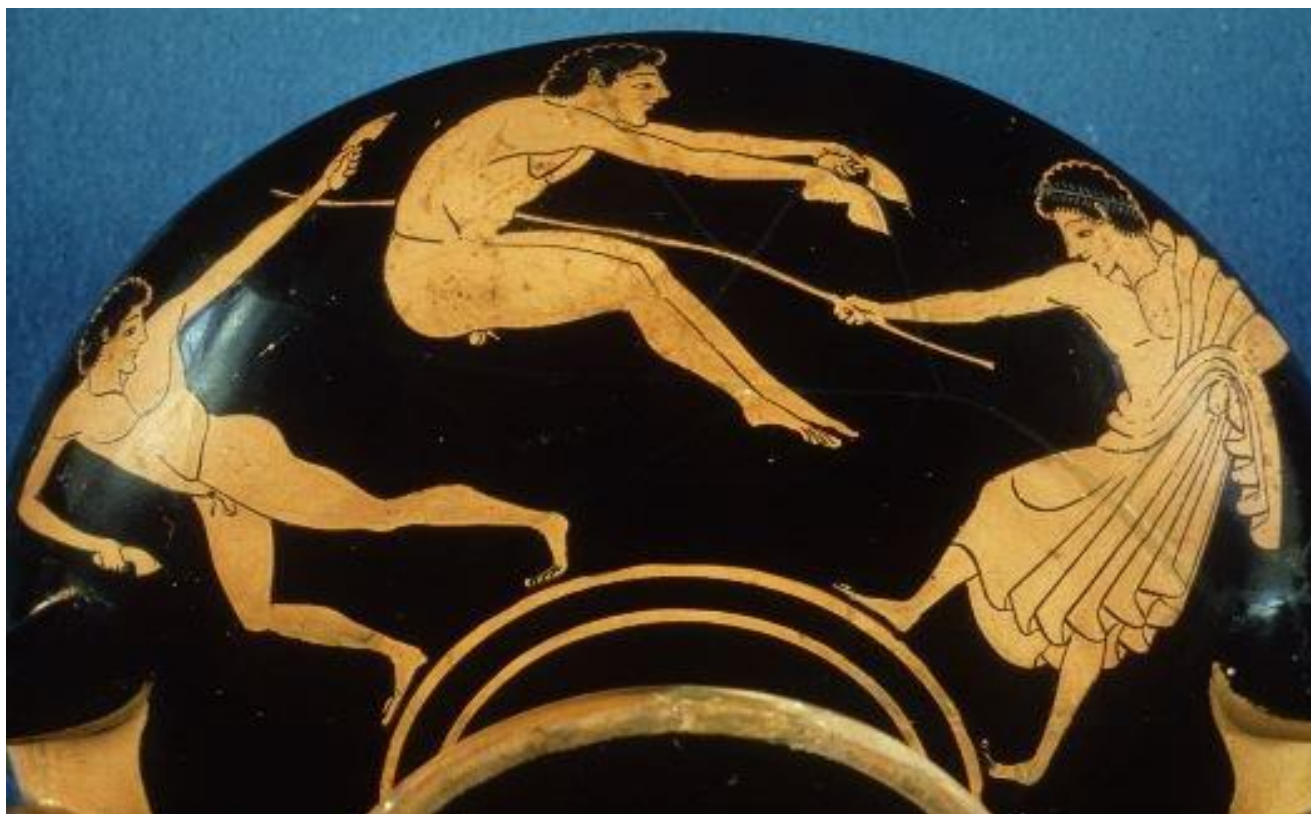
Coupe à figures rouges, VI e siècle avant J.-C., Paris, Musée du Louvre.

Τί εἰμι ; [ti eïmi] / quid sum ? (= que suis-je ?)