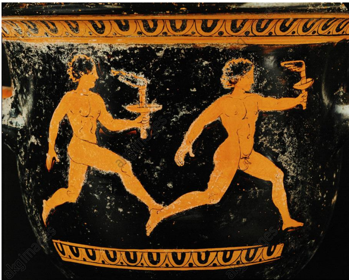
Cratère à figures rouges, IVe siècle av JC, Kunshistorisches Museum, Vienne, Autriche.

Τί εἰμι ; [ti eimi] / quid sum ? (= que suis-je ?)