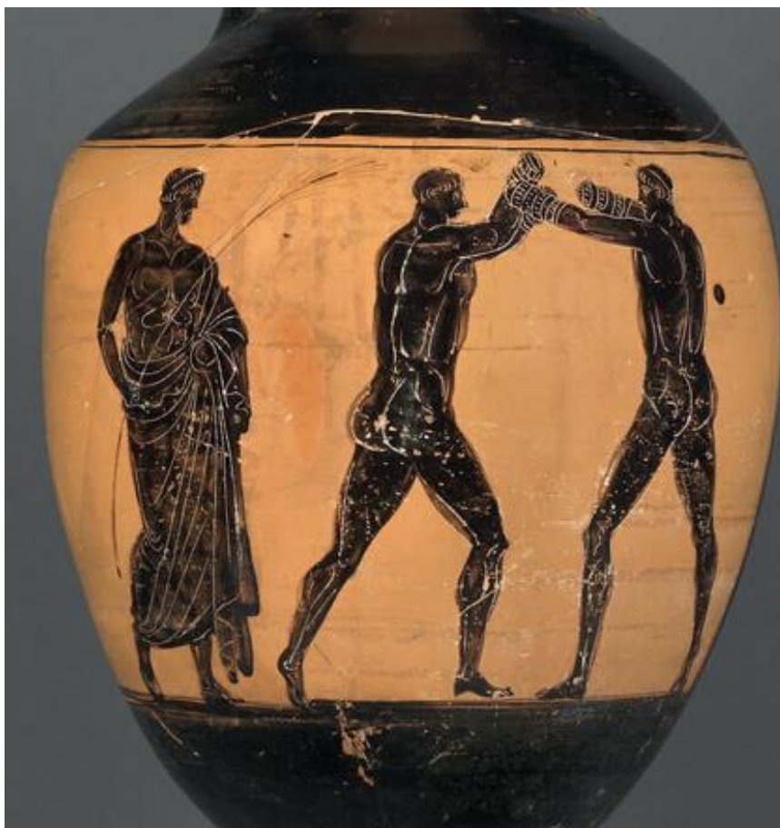
Coupe à figures noires, Vème siècle av JC, British Museum, Londres.

Τί εἰμι ; [ti eïmi] / quid sum ? (= que suis-je ?)