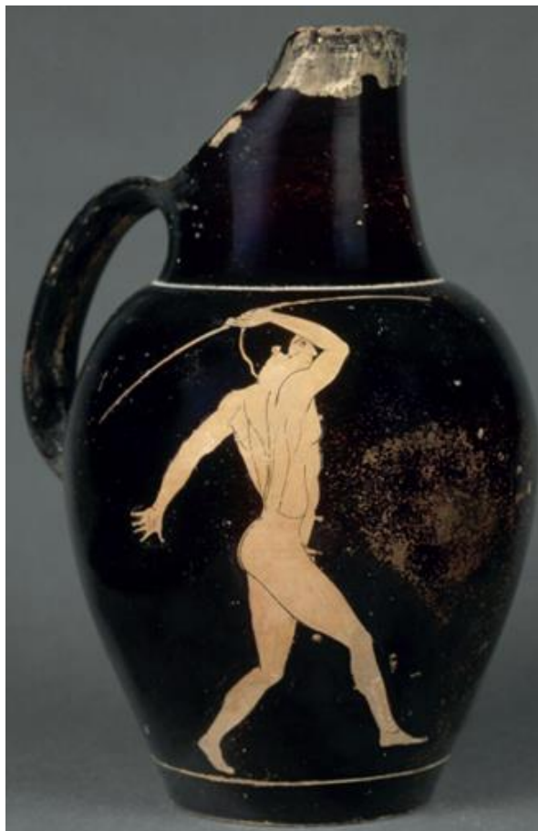
Ēnochoé/ Vase à vin attique à figures rouges, vers 450 av. J.-C., musée du Louvre à Paris.

Τί εἰμι ; [ti eïmi] / quid sum ? (= que suis-je ?)