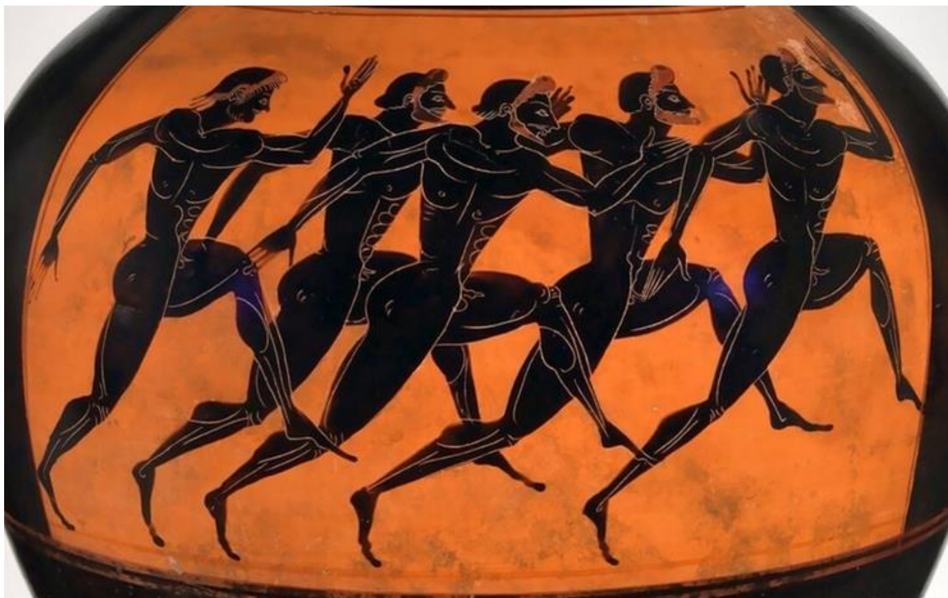
Amphore panathénaïque à figures noires, environ IV e me siècle avant JC, Bengazi (Libye).

Τί εἶμι ; [ti eïmi] / quid sum ? (= que suis-je ?)