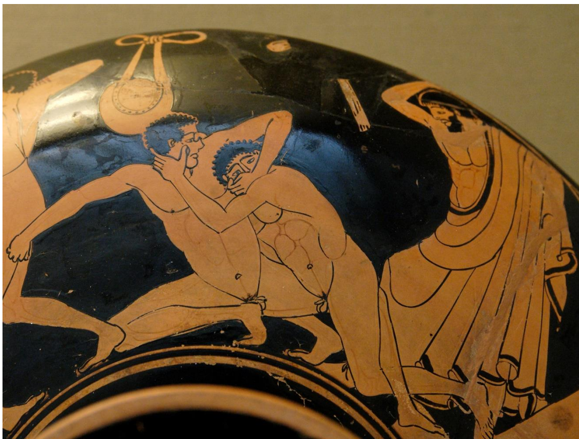
Kylix/ Vase grec, 490-480 av. JC, British Museum, Londres.

Τί εἰμι ; [ti eïmi] / quid sum ? (= que suis-je ?)