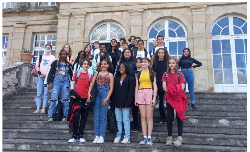
La journée se termine par une petite photographie « souvenir » sur les marches de la terrasse ! Visiblement, les élèves ont le sourire aux lèvres !

Pour un complément d'histoire, visiter le site officiel du château de Sully : https://www.chateaudesully.com/un-peu-d-histoire