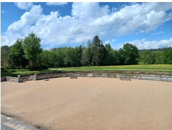
Vue de la terrasse donnant sur les douves : ces dernières abritent des carpes de plus de deux cents ans !