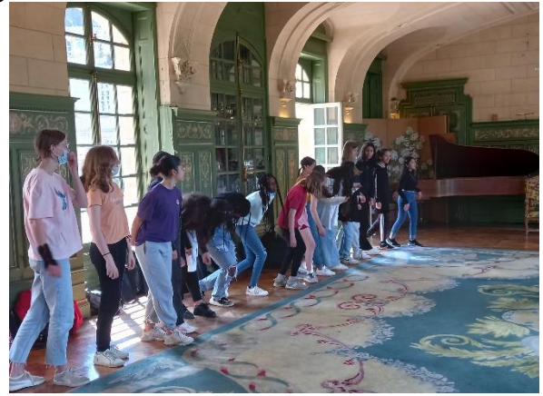
...puis les dames à leur tour, avec grâce et élégance (ou pas) !