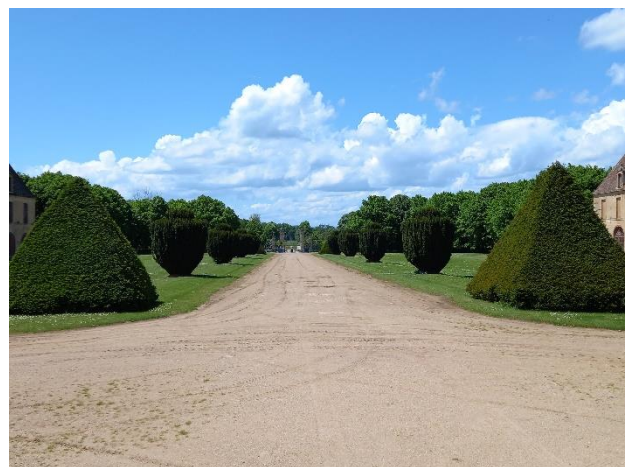
Allée principale menant aux grilles d'entrée.