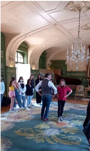
Petit cours privé avec le « Maestro »...