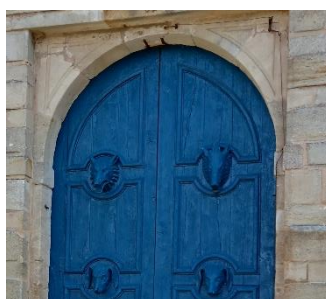
Il nous montre sur la porte la présence d'un loup, d'un sanglier et d'un basset, trois symboles de la famille de Saulx-Tavannes et un vif rappel de leurs grandes aptitudes au maniement des armes ! Visiteurs soyez prévenus !