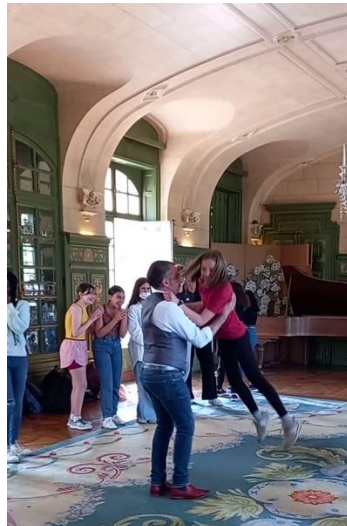
...qui se termine en « tourbillon » ! (« Volt ! »)