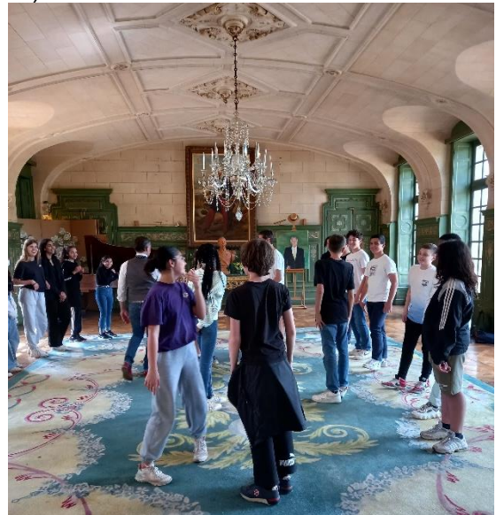
Les élèves à leur tour s'essayer au quadrille. Un grand moment dont ils se souviendront.