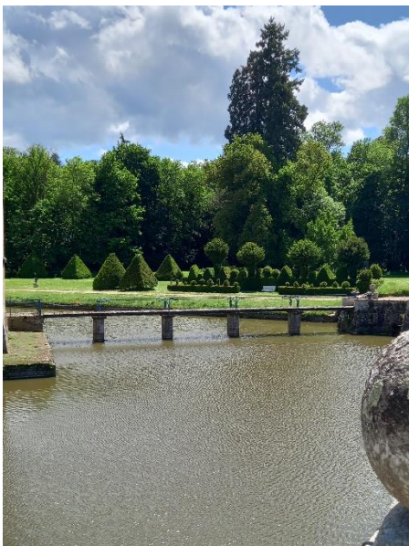
Découverte des jardins autour des douves.