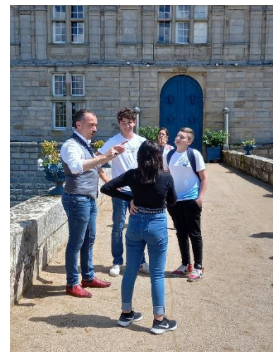
Thomas a ensuite décidé d'enrôler de nouveaux membres du personnel pour le château.