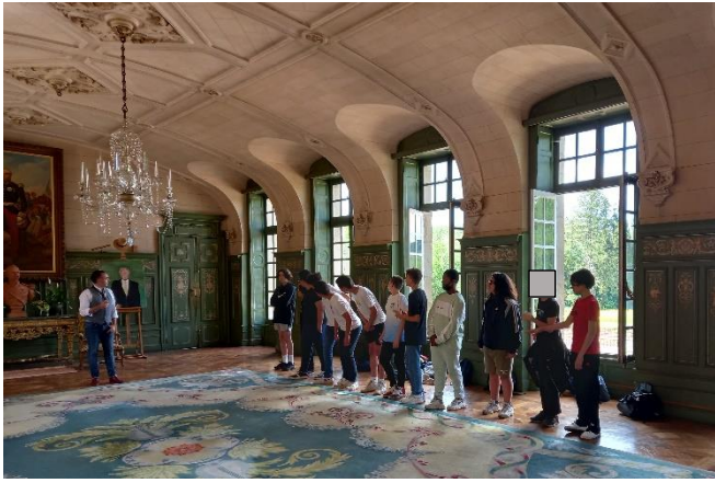
Les messieurs saluent les premiers...